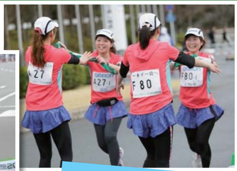
1区から2区への タスキをつなぐペア駅伝