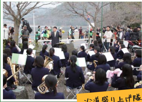
治道盛り上げ隊も大活躍!